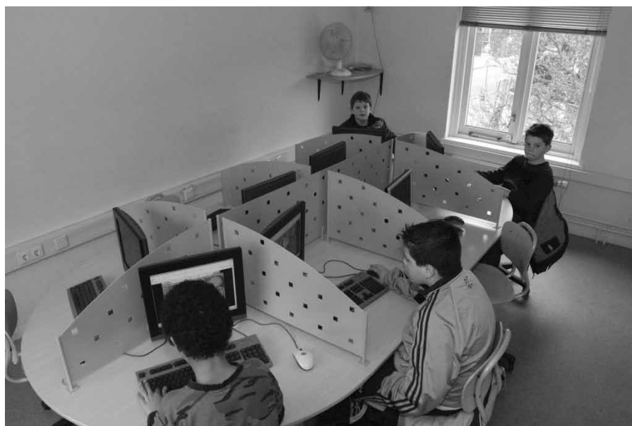
Binnen bij digitaal trapveld K73 aan de Kolpingstraat. Door besluiten van de gemeente verhuist dit computercentrum naar Buurtcentrum De Inloop, vooraan in de Kolpingstraat.

De gemeente schrijft ook dat er hiermee een meer structurele oplossing voor het digitale trapveld gevonden is. En dat klopt. Nadat de meeste van